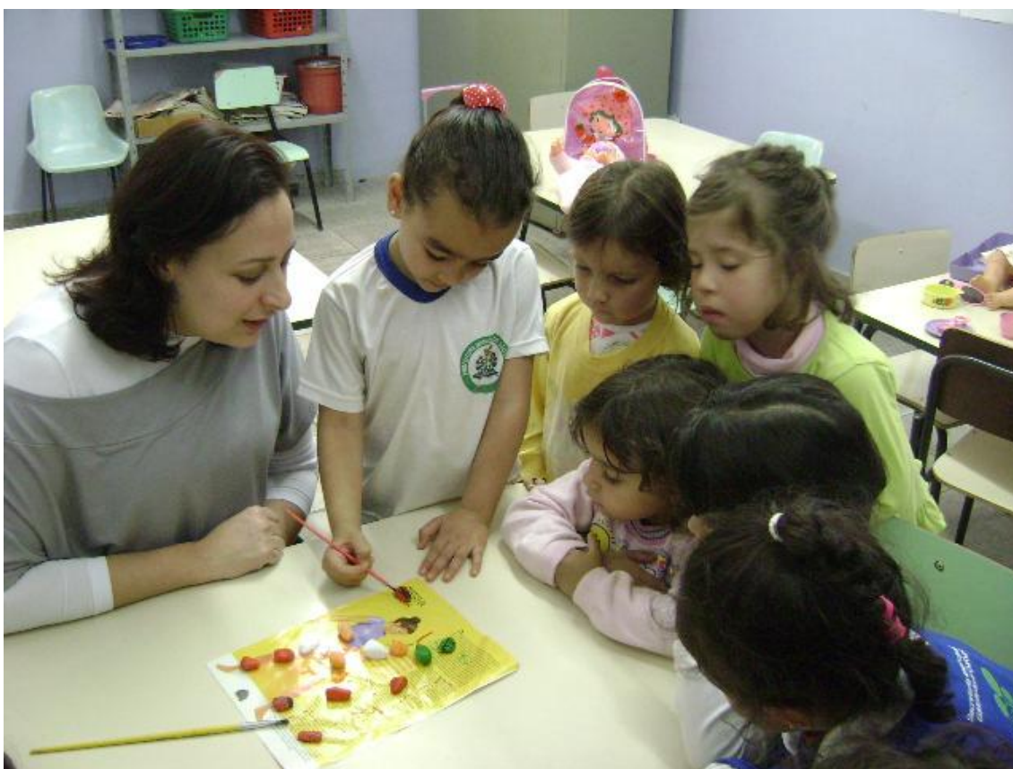
Crianças pintando pedregulhos que simboliza as joaninhas Fig 1

Após as explicações e descobertas fizemos em grupo a representação simbólica de uma joaninha utilizando os materiais: pedra, tinta guache e tinta para tecido. Nesta atividade pintamos uma joaninha em uma pedra conhecida como pedregulho que se parece com o corpo da joaninha como mostra Fig1. Pintamos joaninhas de diferentes cores: amarelas, vermelhas laranjas e verdes. Fizemos as pintinhas de preto com tinta para tecido para fixar na pedra. A representação do alimento da joaninha foi feita com a massa de modelar, ou seja, fizemos a folha com a massa de modelar verde e o pulgão (o alimento da joaninha) com a massa de modelar marrom ou amarela.